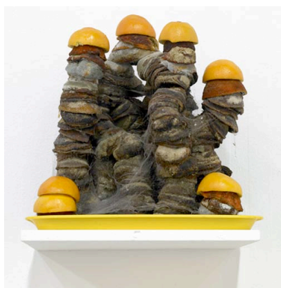
Michel Blazy : Sculpture , 2007, monticules d'écorces d'oranges moisies.

D'une durée d'une heure, cette activité d'éveil artistique a pour objectif d'aiguiser le regard et l'imaginaire des enfants et de porter une réflexion sensible sur la démarche de Michel Blazy.