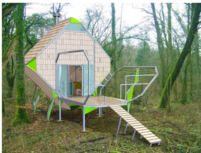
matali crasset, les maisons sylvestres : le nichoir , sentier Le Vent des forêts, Meuse, 2010.

Cette exposition rendra compte du regard posé par Matali Crasset sur l'aménagement que ce lieu lui aura inspiré, en relation avec la ville.