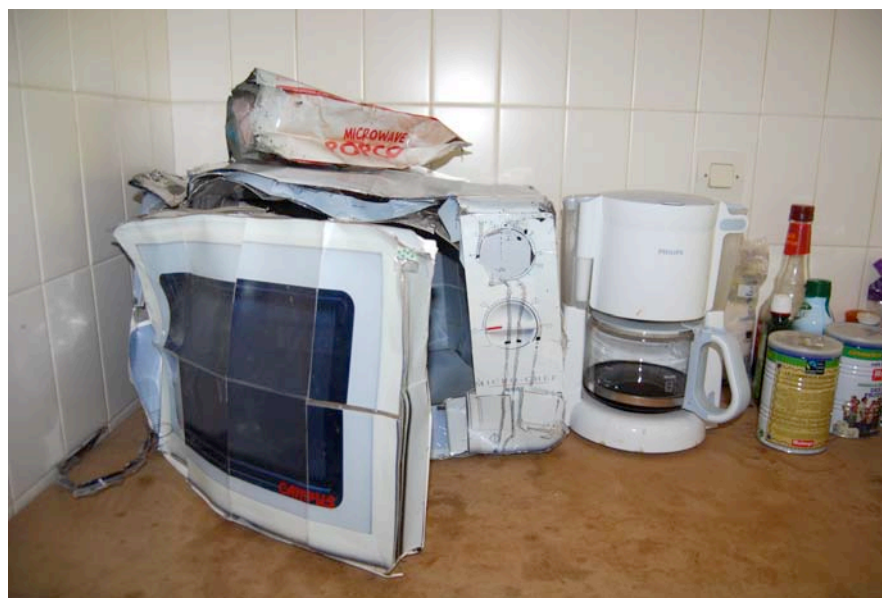
Cyril Hatt, Four à Micro-ondes , 30 x 60 x 40 cm, prise de vue numérique, tirages argentiques, agrafes, 2008.

Plongé dans cet univers domestique le visiteur aura la possibilité d'expérimenter le procédé technique de l'artiste et de se concocter sur place des plats factices au gré de ses envies.