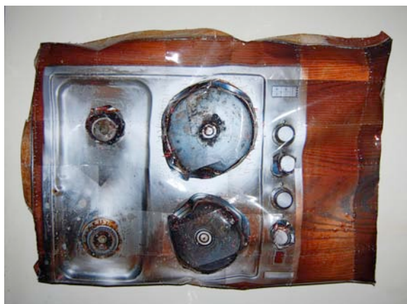
Cyril Hatt, Plaque de cuisson , 60 x 105 x 15 cm, prise de vue numérique, tirages argentiques, agrafes, 2009.

Diverses thématiques peuvent être abordées autour de l'exposition de Cyril Hatt La Tambouille . Selon les axes que vous développez dans votre enseignement, la visite peut être orientée pour nourrir un travail en arts visuels et en histoire de l'art mais aussi dans les champs du vocabulaire, du langage, ou de la technologie.