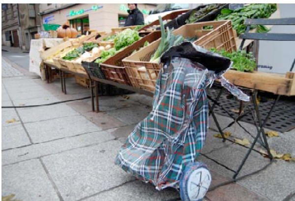
Cyril Hatt, Chariot de course , 69 x 33 x 27 cm, prise de vue numérique, tirages argentiques, agrafes, 2009.

D'une durée d'une heure, cette activité d'éveil artistique a pour objectif d'aiguiser le regard et l'imaginaire des enfants et de porter une réflexion sensible sur la démarche de Cyril Hatt à partir de l'observation de l'installation La Tambouille .