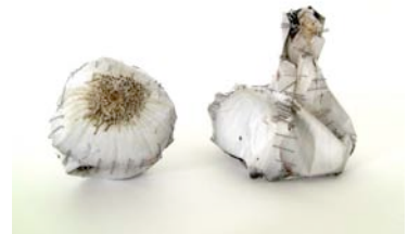
Cyril Hatt, aïl , prise de vue numérique, Tirages argentiques, agrafes, 2009.

L'expression artistique portera sur l'originalité, l'esthétique et la recherche d'harmonie de couleurs à donner à leur composition.