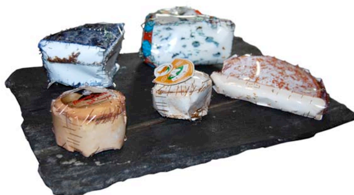
Cyril Hatt, plateau de fromage , 2010.

Exposition du 11 septembre au 6 novembre 2010 à la médiathèque de Nègrepelisse