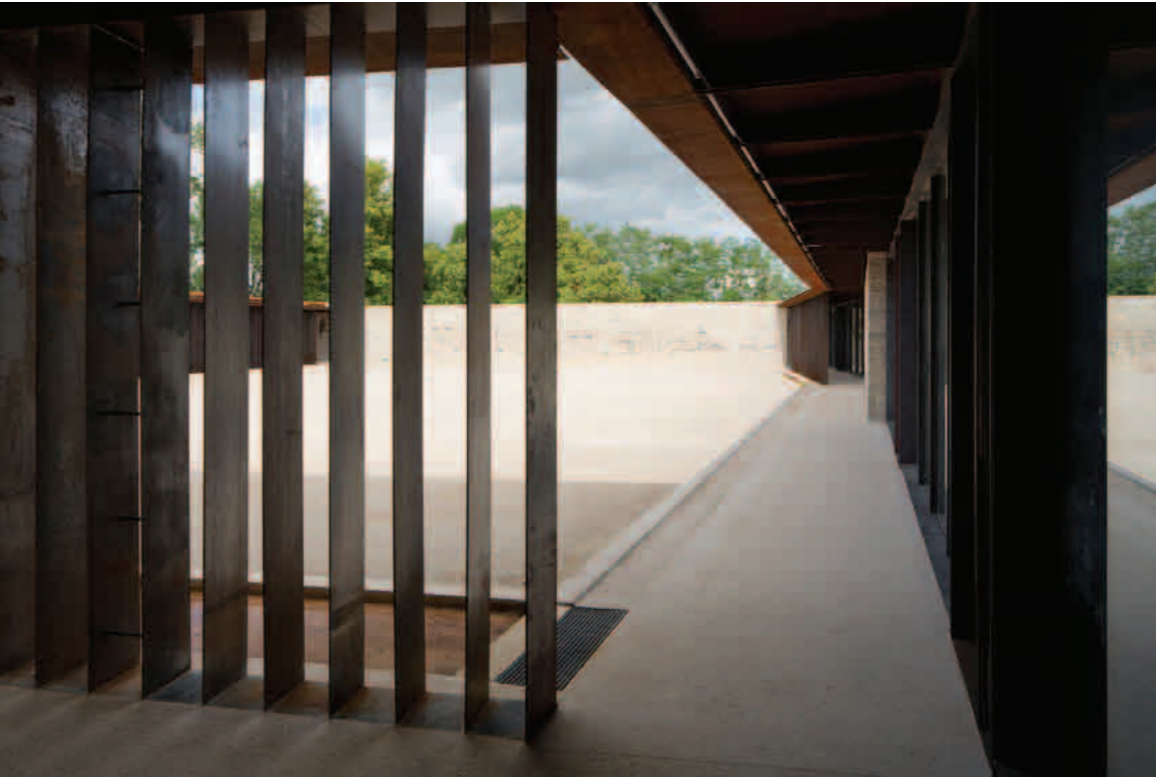
La cuisine, centre d'art et de design, château de Nègrepelisse, juin 2014. Architectes : RCR.