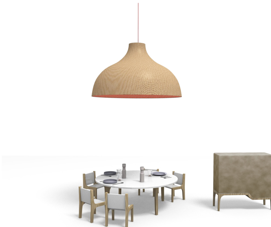
Lumone, Animalis, mobilier et vaisselle conçus par a+b designers Projet de design global mené à Nègrepelisse avec le centre de création La cuisine

L'exposition Ciels domestiques présente des prototypes de mobilier, de vaisselles, des esquisses, des maquettes et bien d'autres documents conçus par a+b designers. Plus qu'une exposition, Ciels domestiques permet de rentrer au coeur du processus de création d'un projet de design global mené sur un nouvel espace de restauration à destination d'enfants de 2-3 ans à Nègrepelisse.